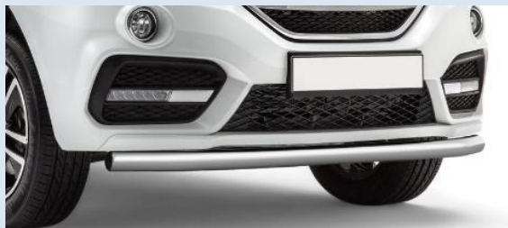
1LPTG14010103 Защита переднего бампера одинарная Норматив установки 1 н. ч.