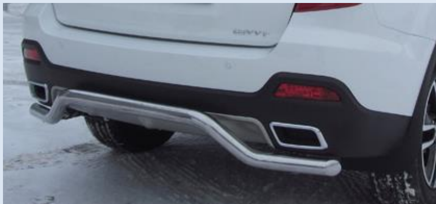
Защита заднего бампера "волна" D57 Норматив установки 1 н. ч. 1S2SR28