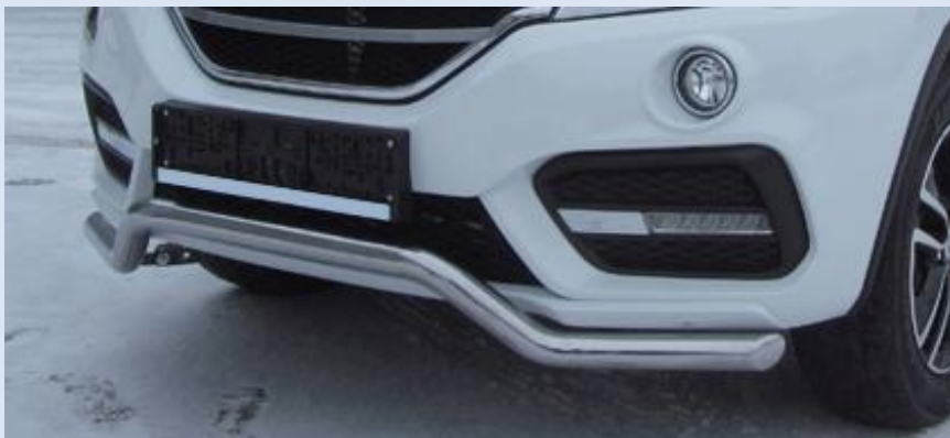
Защита переднего бампера D57 Норматив установки 1 н. ч. 1S2SR21