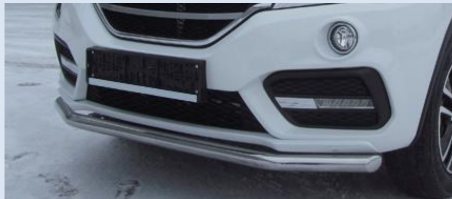
Защита переднего бампера "волна" D42 Норматив установки 1 н. ч. 1S2SR202