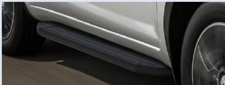
Пороги ступени "Classic" Норматив установки 2.4 н. ч. 1SFR20