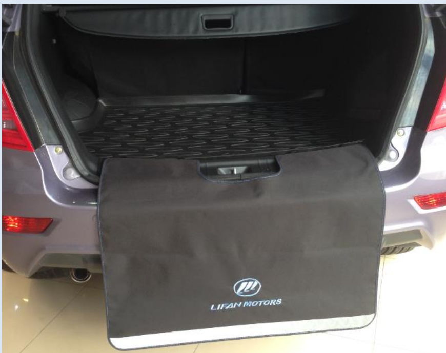
Погрузочный коврик 1UFN00B