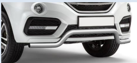
1LPTG14010106 Защита переднего бампера «Волна» Ø63мм Норматив установки 1 н. ч.