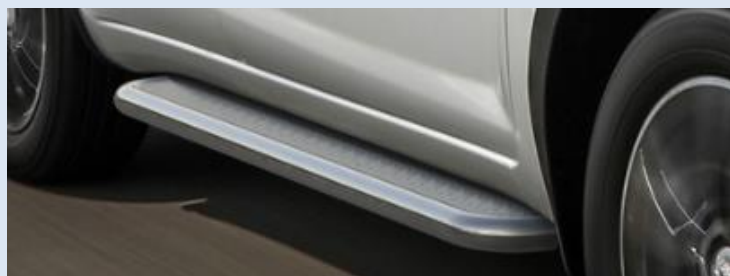
Пороги с листом d57, Норматив установки 2.4 н.ч. 1SRR24