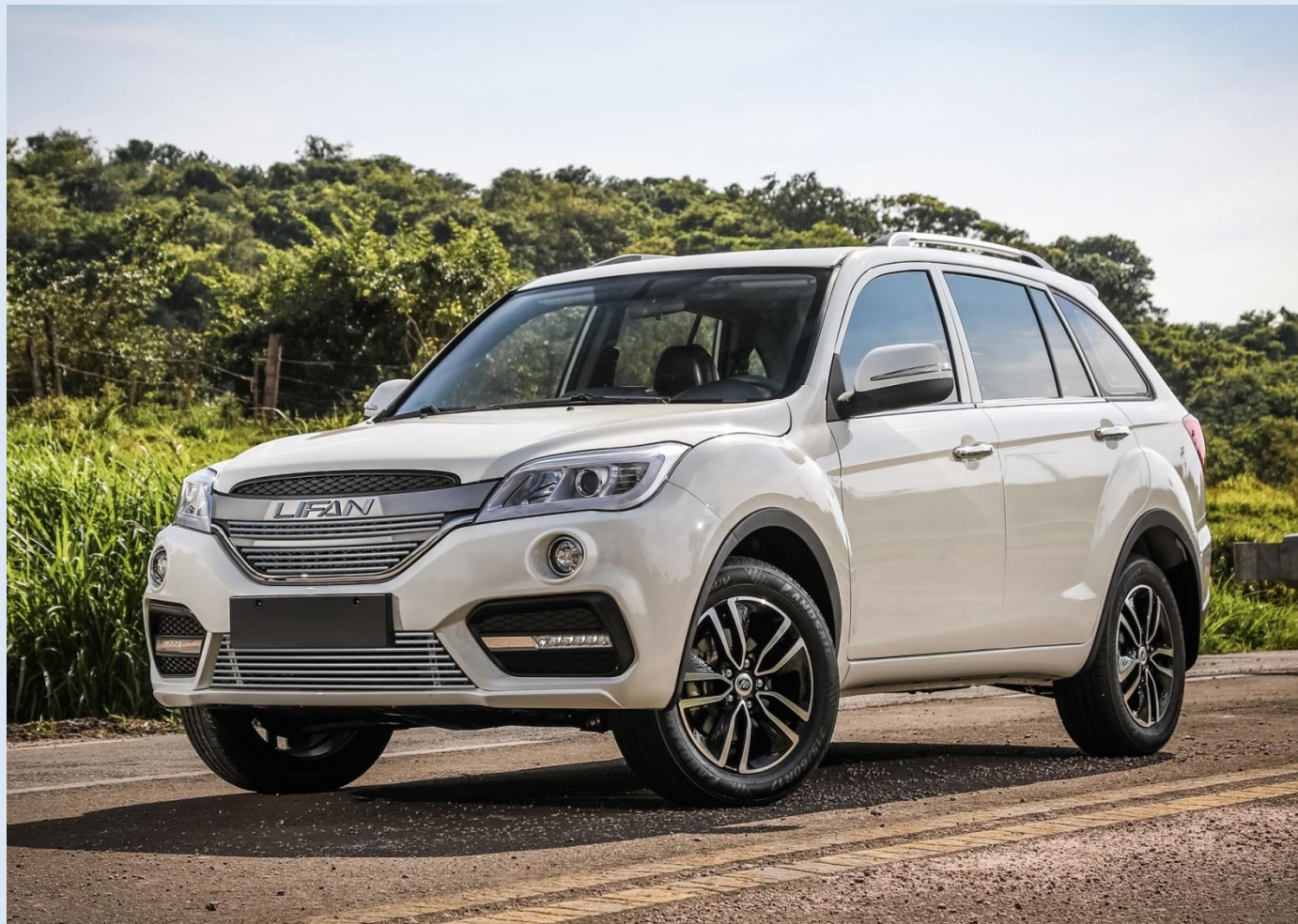
Решетка бампера D10 Норматив установки 1.5 н. ч. 1SRRA00