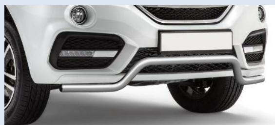
1LPTG14010105 Защита переднего бампера «Волна» Ø51мм Норматив установки 1 н. ч.