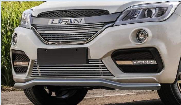
Защита переднего бампера D57 "волна" Норматив установки 2.4 н.ч. 1S2RR20