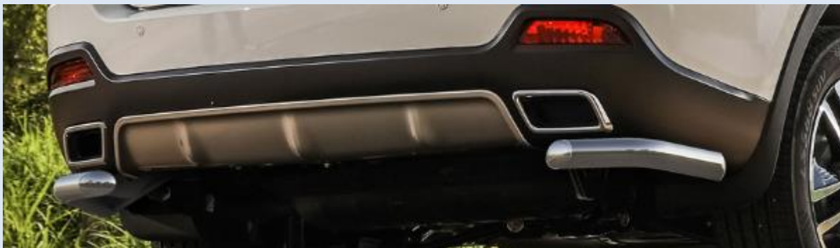
Защита заднего бампера D57 "уголки" Норматив установки 1 н.ч. 1S2RR31