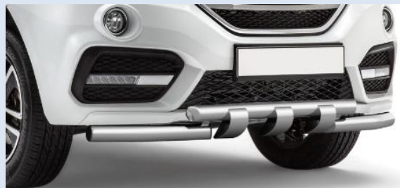
1LPTG14010108 Защита переднего бампера двойная с зубьями Ø63/63мм Норматив установки 1 н. ч.