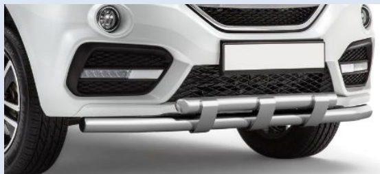
1LPTG14010107 Защита переднего бампера с пластинами Ø63/63мм Норматив установки 1 н. ч.