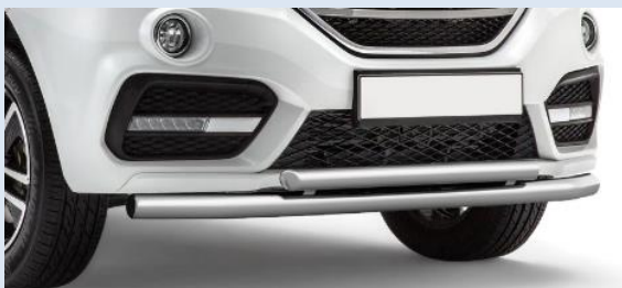
1LPTG14010104 Защита переднего бампера двойная Норматив установки 1 н. ч.