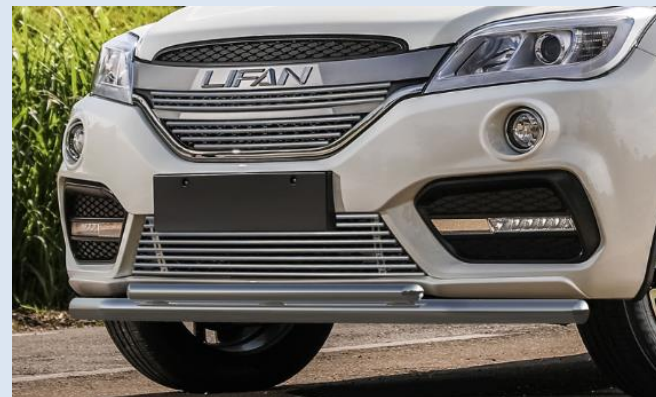
Защита переднего бампера D57+D42 Норматив установки 2.4 н.ч. 1S2RR21