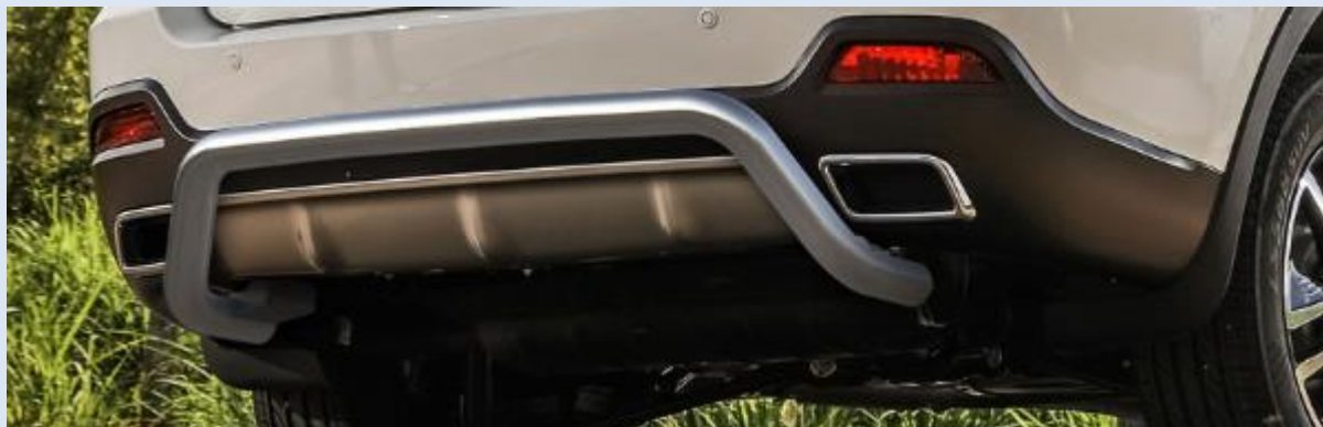
Защита заднего бампера D57 "Скобка" Норматив установки 1 н.ч. 1S2RR28