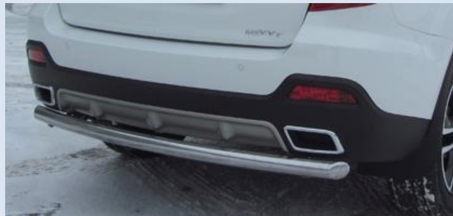
Защита заднего бампера "радиусная" D57 Норматив установки 1 н. ч. 1S2SR30