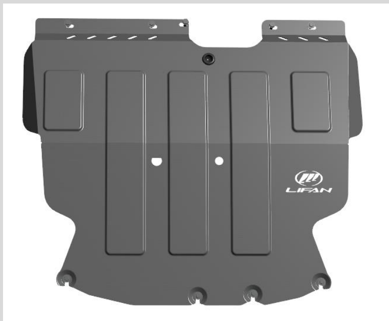
Защита картера и КПП Lifan X60 (сталь) Норматив установки 0,5 н. ч. 1SM7610

Оригинальная защита разработана специально для автомобиля Lifan X60, что дает ряд преимуществ: