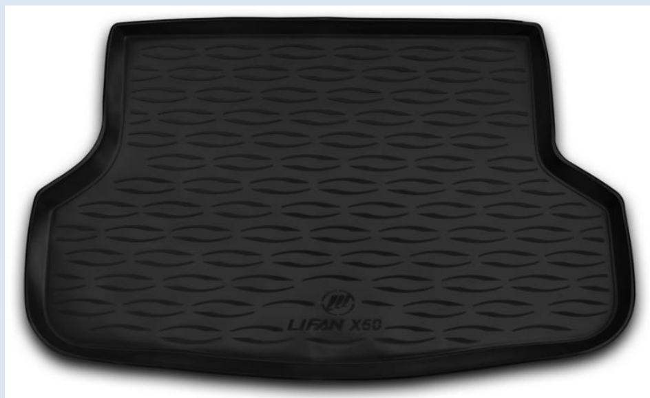
Коврик в багажник (полиуретан) 1SFN00S