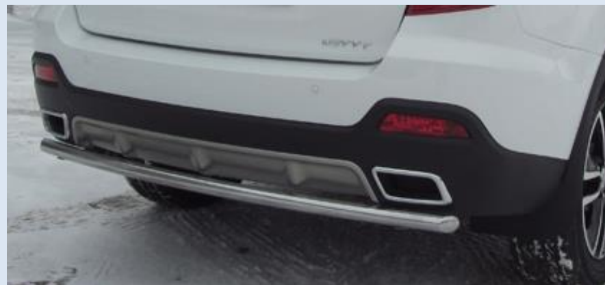
Защита заднего бампера "радиусная" D42 Норматив установки 1 н. ч. 1S2SR301