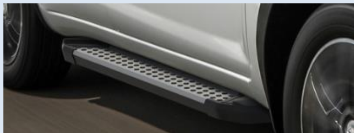
Пороги ступени "X-Style" Норматив установки 2.4 н.ч. 1SFR21