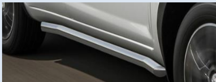
Пороги труба "изогнутая" D57 Норматив установки 2.4 н.ч. 1SRR32