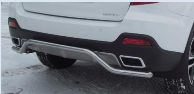
Защита заднего бампера "волна" D42 Норматив установки 1 н. ч. 1S2SR282