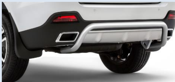
1LPTG14010302 Защита заднего бампера «Волна» Ø51мм Норматив установки 1 н. ч.